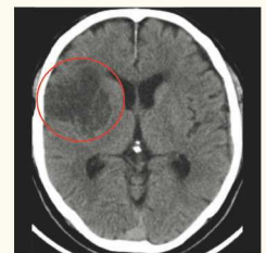
アテローム血栓性脳梗塞

頸部の動脈や頭蓋内の比較的太い動脈に血管狭窄が進行した場合に脳梗塞を発症します。症状の進行が比較的早く、薬物による内科的治療でも病状が悪化することがあり、その場合に血行再建を目的とした手術が必要となる場合があります。