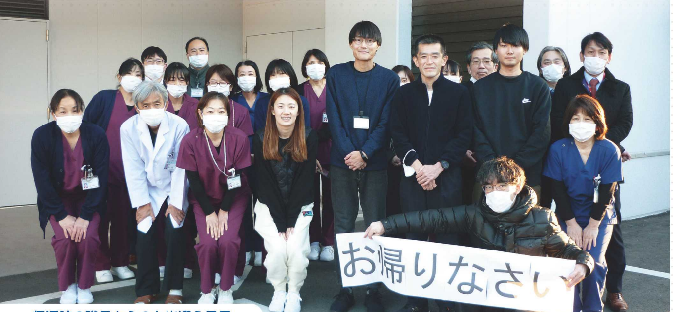
帰還時の職員からのお出迎え風景

今後は長期化する避難生活をどう乗り越えていくかが重要です。過去の事例から、どう備え、助かった命を救いきるか。切れ目のない支援をつなげ、災害関連死を防ぐ取り組みを進めていく必要があります。能登の皆様へ、1日でも早く日常が戻ることを願っております。