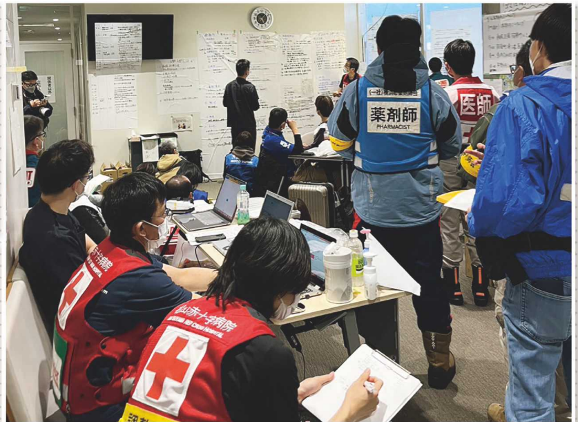
災害現場の様子など